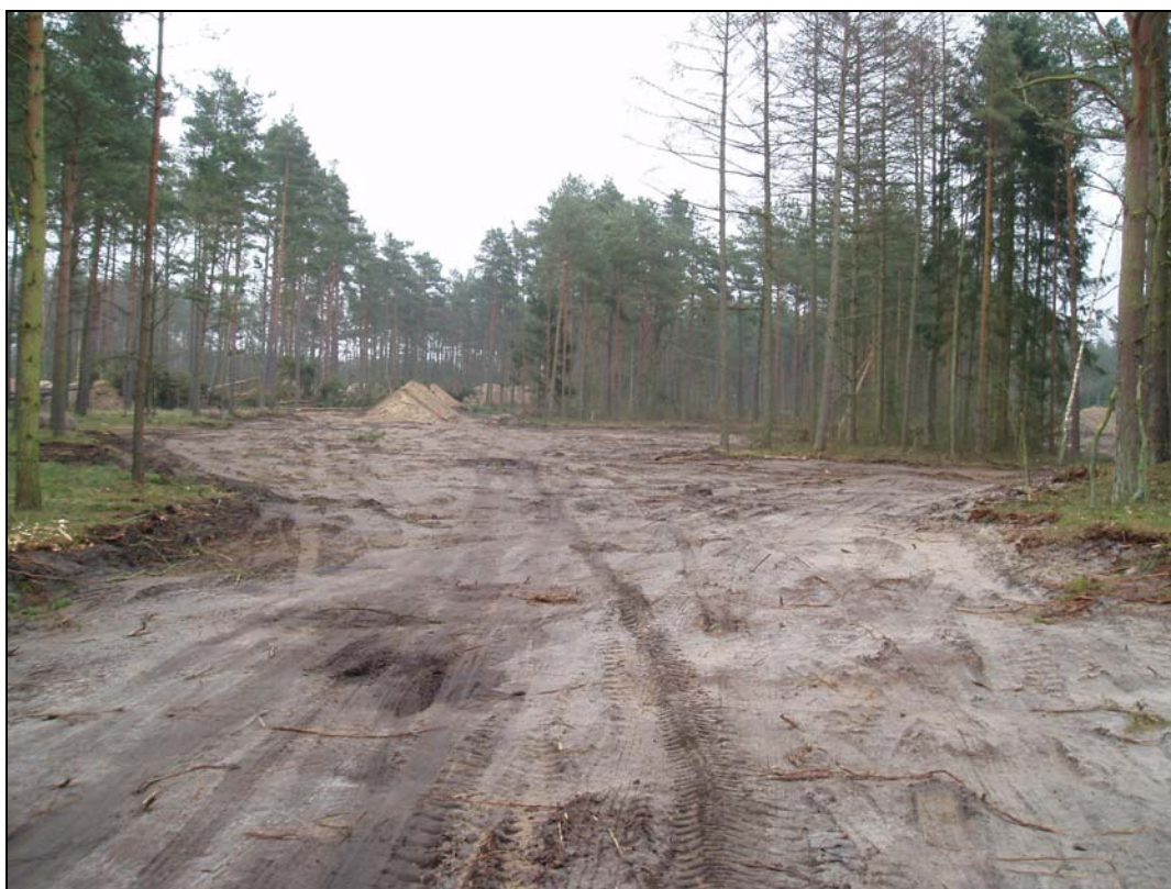
Del av anläggningsområdet fotograferat mot Ö.