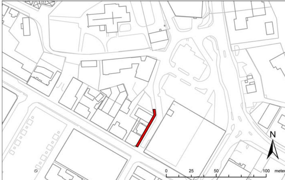
Kontrollerat schaktavsnitt i plan resp. fotograferat mot nordväst.

På begäran av länsstyrelsen genomförde Blekinge museum en särskild undersökning i samband med markingrepp för fjärrvärme i kv. Per, Ronneby. Det arkeologiska arbetet utfördes i form av en besiktning och dokumentation av ett omkring 30 m långt schaktparti på Prinsgatan. Varken antikvariskt intressanta strukturer eller fynd framkom i samband med den arkeologiska arbetsinsatsen. Dokumentation i form av en sektionsritning samt nio digitalfotografier förvaras i Blekinge museum.