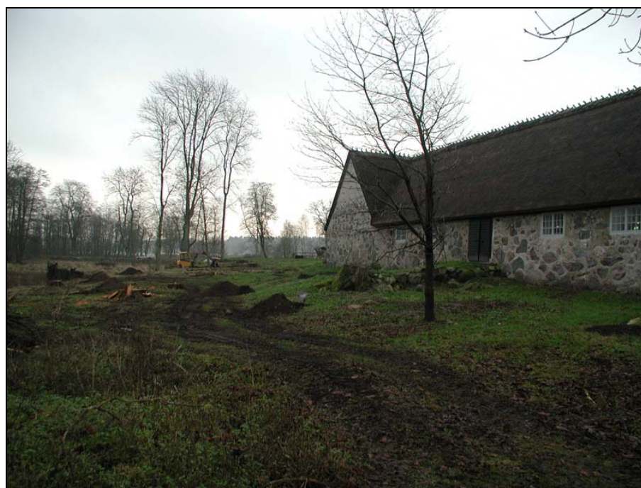
Nyplanteringsschakt, överblick mot SO.