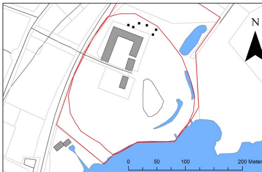
Schakt för nyplantering i förhållande till Sölvesborgs slottslängor.

Kartanvändning: ©LMV, Gävle, 2007, ©LMV Årende nr M2005/2857.