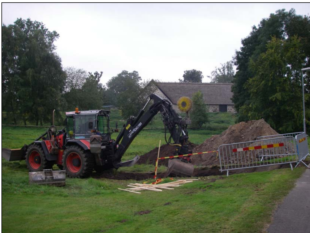
Bilaga 1b – Schaktning NO om Sölvesborgs slottslängor.