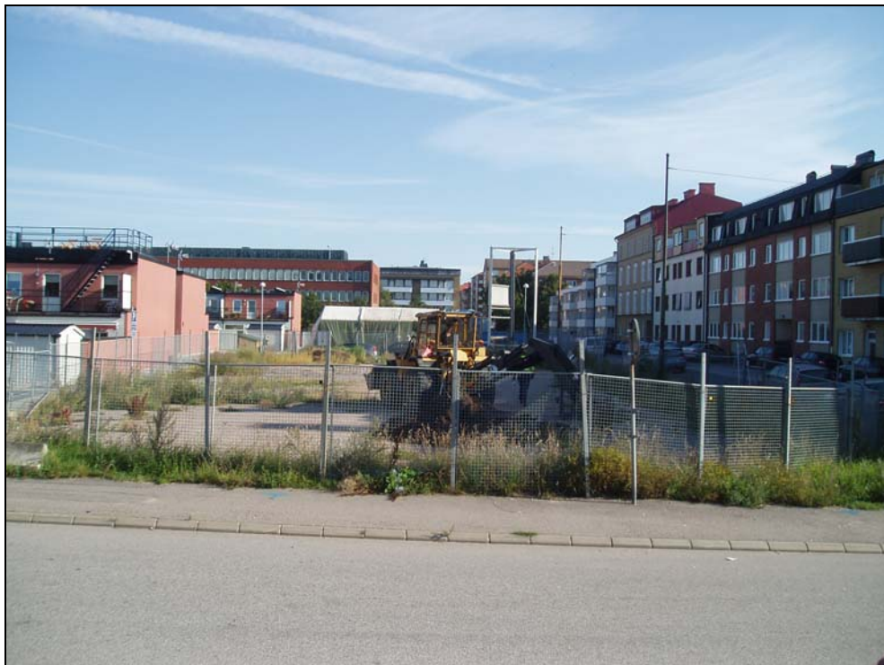
Bilaga 1b – Överblick över exploateringsområdet, fotograferat mot N.