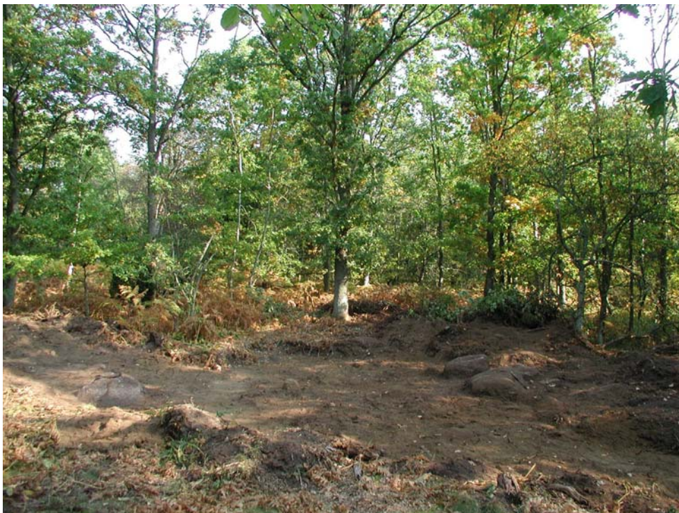
Framschaktad yta under den arkeologiska förundersökningsfasen